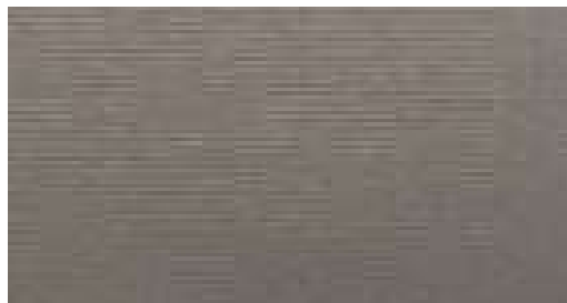
Grigio 980 910