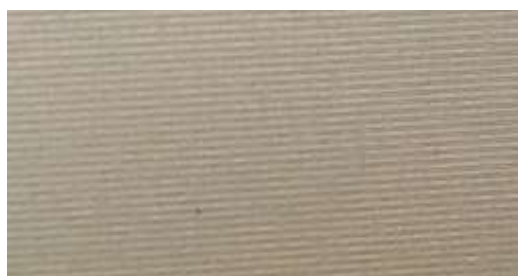
Grigio sabbia 980 920